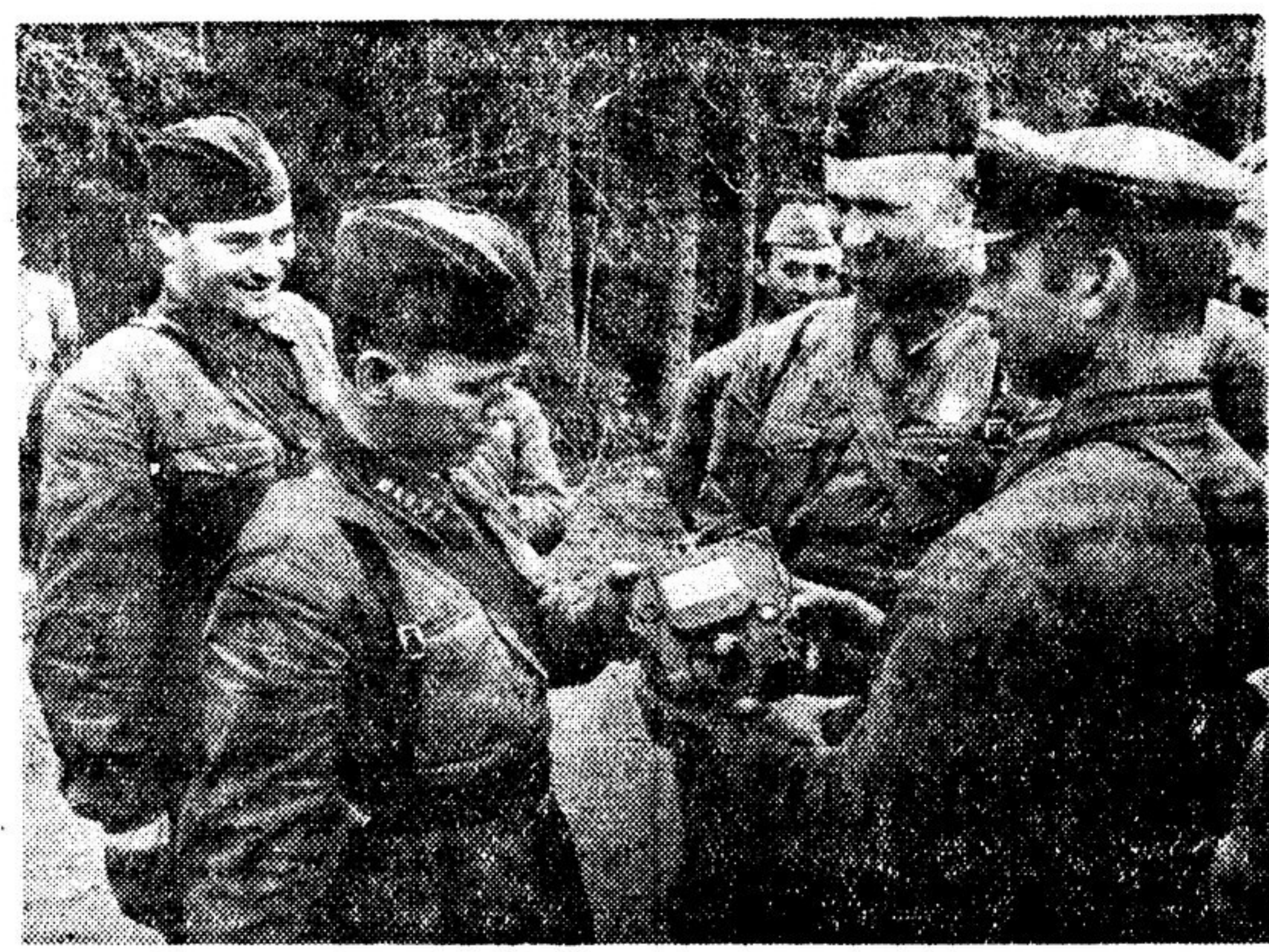
ДЕЙСТВУЮЩАЯ АРМИЯ. М. Шолохов, Е. Петров и А. Фадеев осматривают приборы, снятые с подбитого фашистского танка.