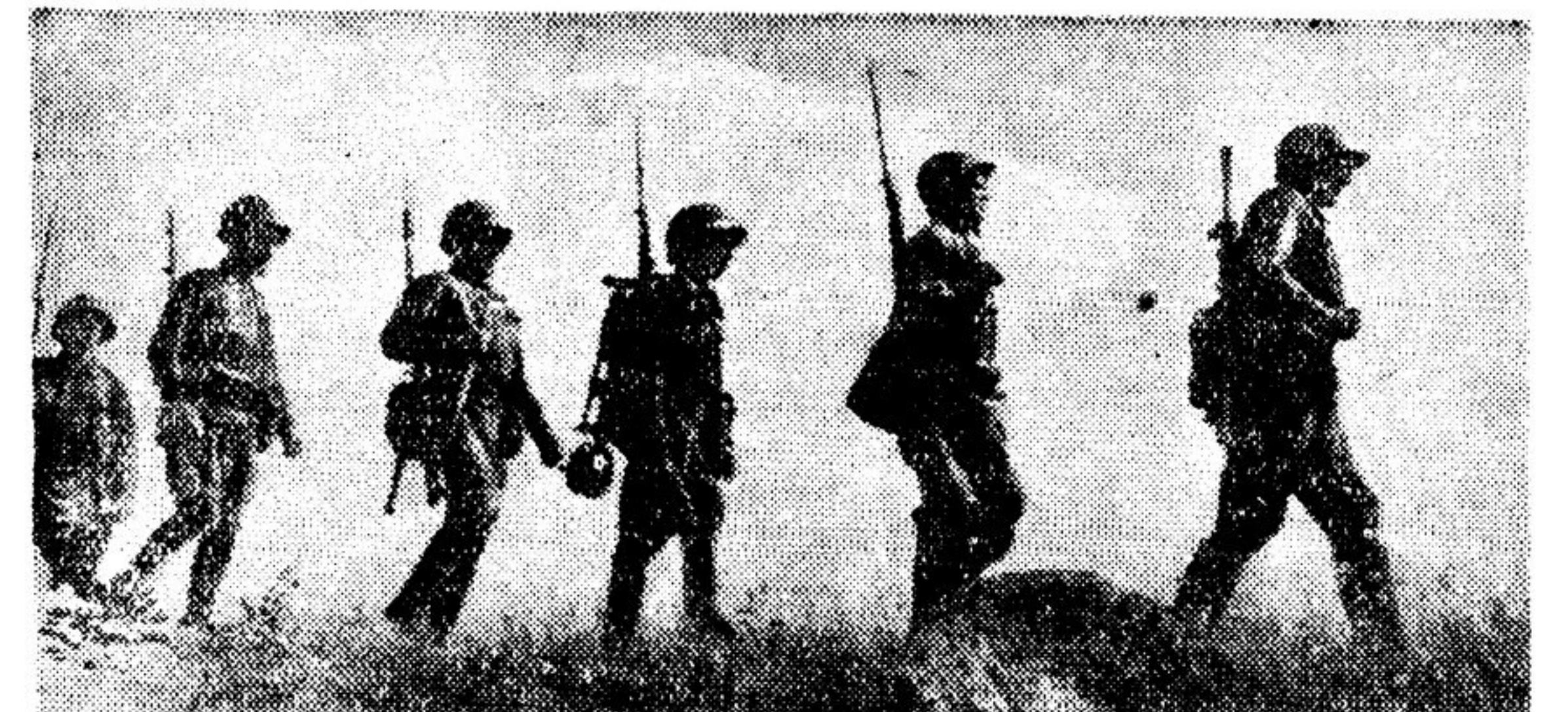
ДЕЙСТВУЮЩАЯ АРМИЯ. К исходному рубежу.